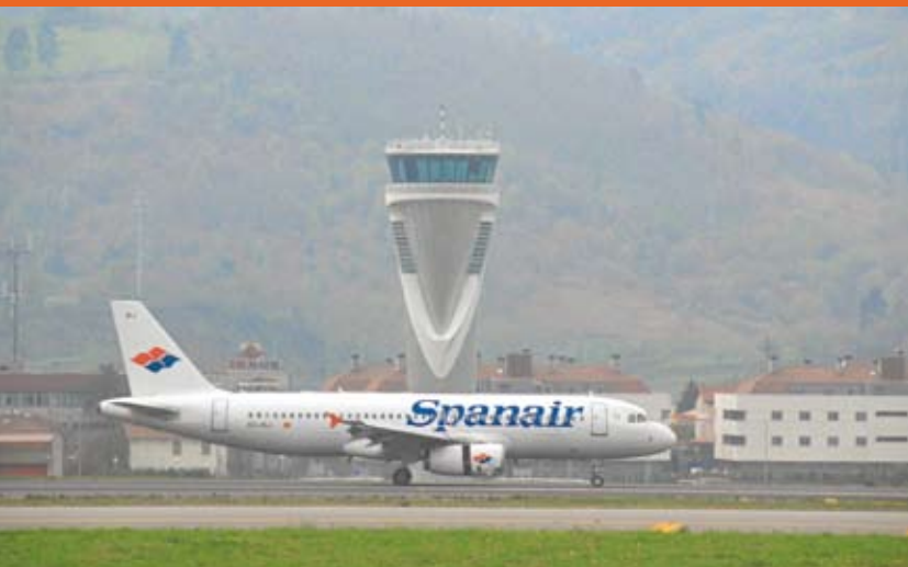
La ampliación de la pista de Loiu es una de las prioridades de Bilbao Air para los próximos años.

Loiu ha experimentado cambios en su primera década de vida. En comodidad y en mejora de la accesibilidad en la zona de llegadas. Los casi cuatro millones de personas que usan al año estas instalaciones y el incremento de destinos han ido variando la fotografía de la terminal