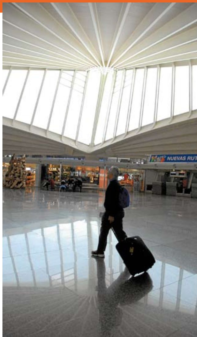
El hall de la terminal es uno de los aspectos más valorados de La Paloma.