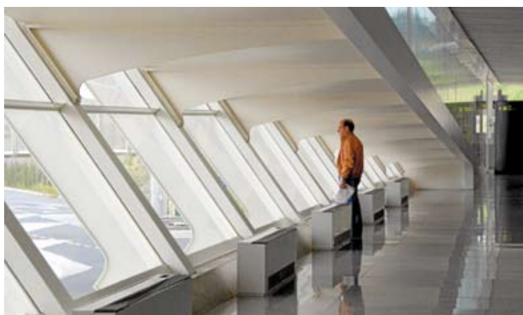
Un mayor confort ha sido la prioridad en las obras de mejora recientes.