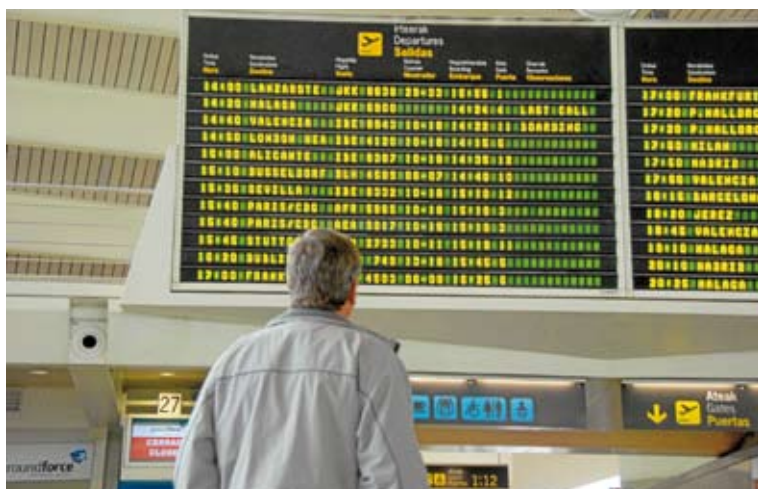
Las nuevas instalaciones han favorecido la llegada de nuevas compañías en estos diez años.