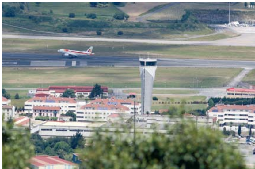
Las compañías aéreas siguen apostando por Loiu.

La campaña de otoño-invierno refuerza las conexiones con Bruselas, Ginebra, Manchester, Londres, Sevilla y Barcelona