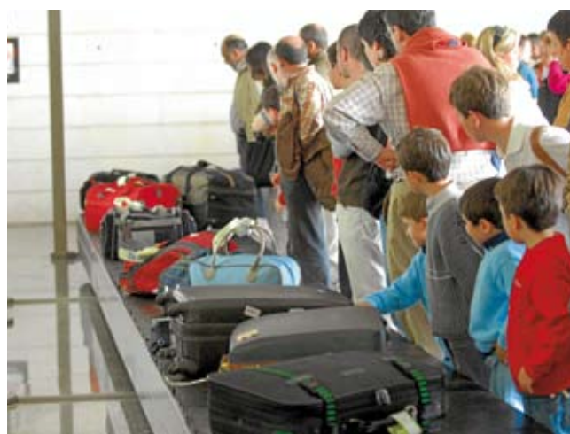
Las previsiones hablan de cuatro millones de pasajeros en 2011.